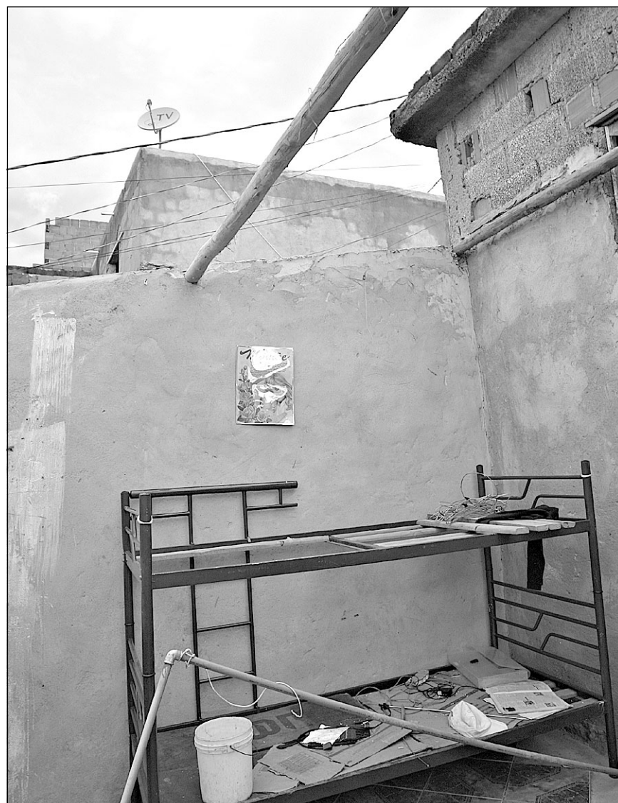
•Força do vento fez voar as telhas de residências na Região Sudeste

Ainda segundo Azevedo, a temperatura começa a cair a partir de hoje. No domingo, a mínima foi de 19,2 graus e a máxima de 29,8 graus. Ontem, a temperatura variou entre 19 e 30 graus. Hoje, a previsão é que a máxima seja de 26 e a mínima de 20 graus.